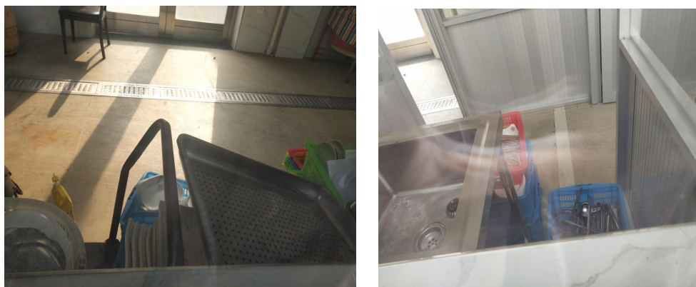
上图为汇头王家宴中心

根据 103 份问卷调查结果，50.48%的被调查者不知道农村家宴放心厨房的存在，同时受疫情影响，农村家宴放心厨房建成验收后利用率不高，实地走访汇头王村家宴中心时发现家宴中心大门紧闭，且无相关人员联系方式，预期使用者无法联系管理者可能导致使用机会流失。此外财政局于 2020 年 11 月 24 日对农村家宴放心厨房项目进行跟踪监控时发现汇头王村家宴中心碗具依墙堆放在地上，不清洁不卫生，市场监管局后续对该事项进行了整改，而我们对整改结果再进行跟踪，发现汇头王家宴中心仍存在盆碗、餐具等依墙堆放在地上的情况。尽管财政局跟踪监控，市场监管局落实整改，但是家宴中心仍未按照规范进行使用。